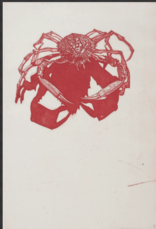
«L'Araignée» Gravure originale de Pierre Collin (coll. MFLS)

Son œuvre, constituée d'allers et retours entre dessin, peinture et gravure, s'inspire de son quotidien. Pierre Collin privilégie les sujets qui lui sont proches, il préfère l'endotique à l'exotique.»