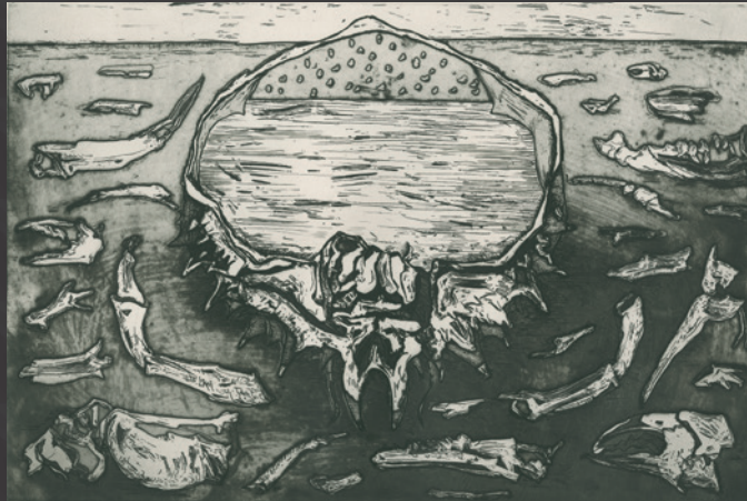
« La mort du crabe » Gravure de Corinne Véret - Collin (coll. MFLS)

« Formée à la gravure aux ateliers de la ville de Paris puis à l'atelier Frélaut-Lacourrière, Corinne Véret - Collin y croquera de nombreux artistes, puis travaillera avec des artistes de la movida Espagnole dans l'atelier Barbara à Barcelone.